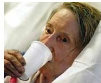
Golpes de calor