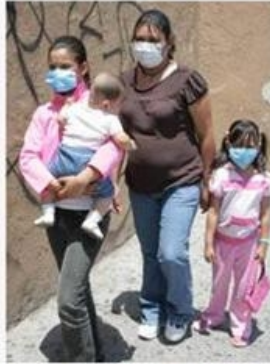
Epidemias de Influenza