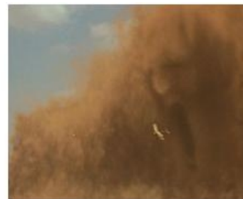
Tormentas de Arena